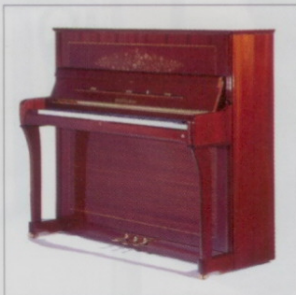
Modell 122 cm

Ed. Seiler Pianofortefabrik • Schwarzacher Straße 40 • D-97318 Kitzingen Tel. 09321-9330 • Fax 09321-36367