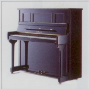
Modell 131 cm

Fordern Sie spezielle Drucksachen an oder fragen Sie Ihren Fachhändler z.B. über DUO VOX, DUO VOX Plus oder ELITE-TRAINER.