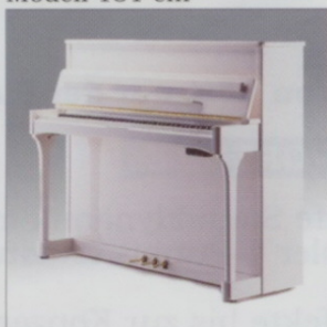
Modell 116 cm

MIDI macht es möglich, Sie in akustisch-digitale Träume versinken zu lassen.