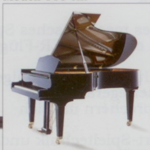
Modell 180/206 cm